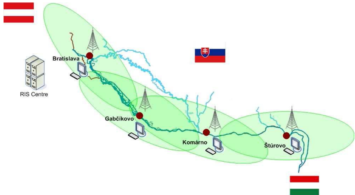
Schéma de la situation et de la couverture des stations côtières AIS sur le secteur slovaque et sur les secteurs communs slovaque-autrichien et slovaque-hongrois du Danube